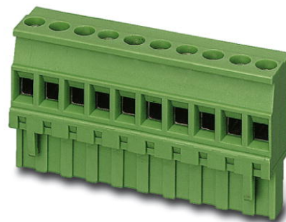
Abbildung zeigt eine 10-polige Variante des Artikels

http://eshop.phoenixcontact.de/phoenix/treeViewClick.do?UID=1792252