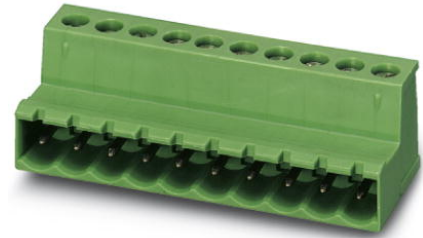
Abbildung zeigt eine 10-polige Variante des Artikels

http://eshop.phoenixcontact.de/phoenix/treeViewClick.do?UID=1786174