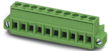
Abbildung zeigt eine 10-polige Variante des Artikels

http://eshop.phoenixcontact.de/phoenix/treeViewClick.do?UID=1778027