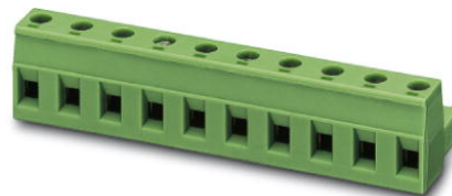
Abbildung zeigt eine 10-polige Variante des Artikels

http://eshop.phoenixcontact.de/phoenix/treeViewClick.do?UID=1766929