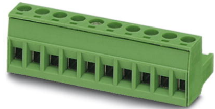
Abbildung zeigt eine 10-polige Variante des Artikels

http://eshop.phoenixcontact.de/phoenix/treeViewClick.do?UID=1757051