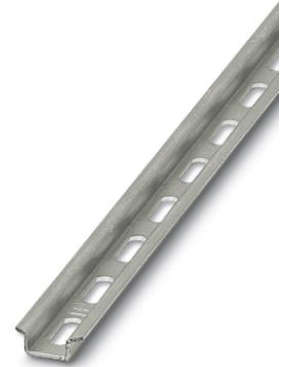
Abbildung zeigt die Variante NS 15 in der Ausführung gelocht und ungelocht

http://eshop.phoenixcontact.de/phoenix/treeViewClick.do?UID=1401682