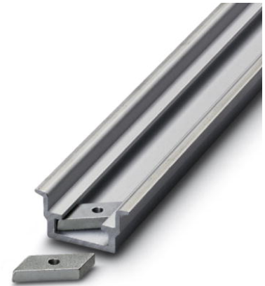
Abbildung zeigt die Variante NS 35/15-AL ungelocht mit der Gleitmutter GLM 4

http://eshop.phoenixcontact.de/phoenix/treeViewClick.do?UID=1201756