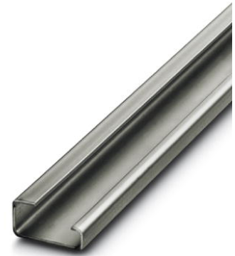
Abbildung zeigt die Variante NS 32 in der Ausführung gelocht und ungelocht

http://eshop.phoenixcontact.de/phoenix/treeViewClick.do?UID=1201015