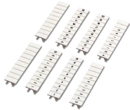
Abbildung zeigt die Varianten ZB 7,5 - UNBEDRUCKT, - LGS:FORTL.ZAHLEN, -QR:FORTL.ZAHLEN und -SO/CMS

http://eshop.phoenixcontact.de/phoenix/treeViewClick.do?UID=0803948