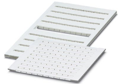
Abbildung zeigt die Varianten ZBM und ZBFM

http://eshop.phoenixcontact.de/phoenix/treeViewClick.do?UID=0803618