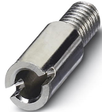
Abbildung zeigt verschiedene Varianten des Artikels

http://eshop.phoenixcontact.de/phoenix/treeViewClick.do?UID=0601292