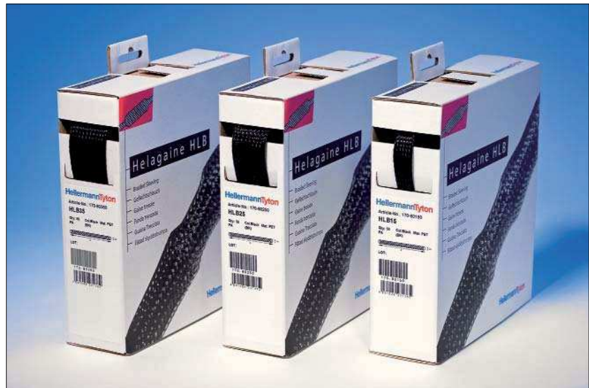
Helagaine HLB – die Aufweirrate 3:1 macht es möglich: nur 3 Größen in der handlichen Spenderbox für fast alle gängigen Durchmesser.

Die praktische Spenderbox und das übersichtliche Sortiment mit seinen großen Anwendungsmöglichkeiten machen Helagaine HLB zum idealen Partner sowohl im Profibereich als auch zu Hause. So lassen sich z. B. Leitungen von Hi-Fi-Anlagen, Präsentations-Equipment oder Kabelstränge von Industrieanlagen bündeln. Neben einer sauberen Optik werden die Leitungen durch Helagaine HLB auch vor Abrieb geschützt.