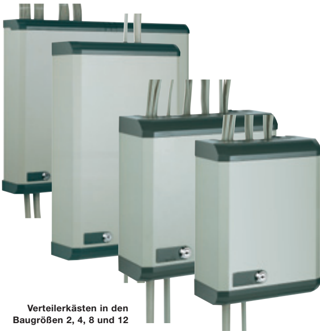
Verteilerkästen in den Baugrößen 2, 4, 8 und 12