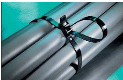
SpeedyTie – schnell und einfach.