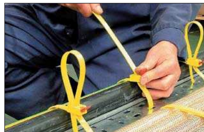
Die Bandenden lassen sich besonders unkompliziert zurückschlaufen.