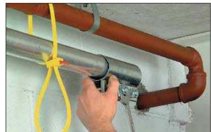
SpeedyTie ist für die temporäre, aber starke Befestigung besonders geeignet.