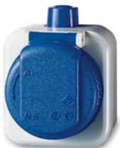
SCHUKO® Steckdose verriegelbar 2300 EWD

Umgebungen, in denen aggressive Stoffe wie Öle, Fette, Reinigungs- und Lösungsmittel, Kohlenwasserstoffe oder organische und anorganische Basen vorhanden sind, erfordern ein Schalterprogramm mit besonders widerstandsfähigem Gehäusematerial – Busch-Duro 2000®WDI. In Verbindung mit den Leitungseinführungen, Typ 2070 und 2071, ist das Programm gegen die meisten aggressiven Stoffe wie Öle, Fette, Reinigungsmittel, Lösungsmittel, Kohlenwasserstoffe, organische und anorganische Basen beständig.