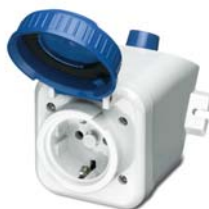
SCHUKO® Steckdose verriegelbar, spannungsloses Stecken durch 2- polige Ausschaltung 2300 EWDV