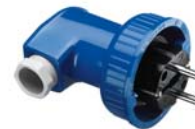
SCHUKO® Stecker verriegelbar, 2-polig 74 WD