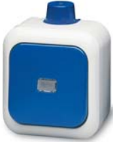
Wippschalter/-taster Busch-Duro 2000® WD