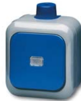
Wippschalter/-taster Busch-Duro 2000® WDI

Bei manchen Anwendungen reicht eine wassergeschützte Elektroinstallation nicht aus. Hier kommt nur ein speziell entwickeltes Schalterprogramm in Frage – Busch-Duro 2000®WD. Hohe Schutzart, Funktionalität, Robustheit sowie ansprechendes Design zeichnen dieses Spezialprogramm aus.