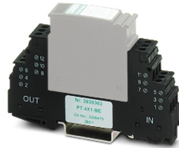
Abbildung zeigt die Variante PT 4x1-BE

http://eshop.phoenixcontact.de/phoenix/treeViewClick.do?UID=2839376