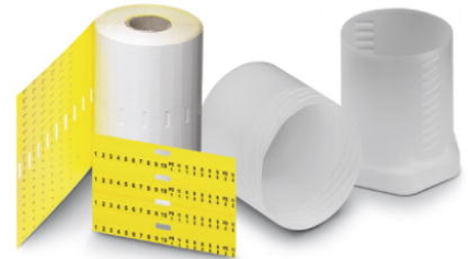
Abbildung zeigt den Artikel TMT 4 R YE

http://eshop.phoenixcontact.de/phoenix/treeViewClick.do?UID=0816498