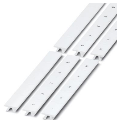
Abbildung zeigt die 18 mm breite Variante

http://eshop.phoenixcontact.de/phoenix/treeViewClick.do?UID=0811972