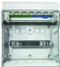
integrierte Steckklemmtechnik für PE und N