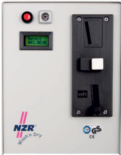
Abb. enthält eingebaute Option O