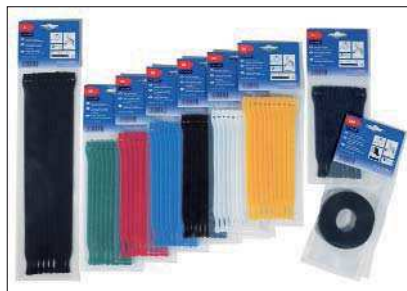
Die TEXTIE-Serie ist in verschiedenen Abmessungen und Farben erhältlich.

Auf Anfrage sind Halter zur Befestigung erhältlich. Sprechen Sie uns an!